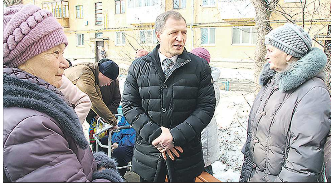
В марте прошлого года во время объезда отдалённых территорий города Игорь Володин говорил о том, что нужно больше уделять внимания их развитию.

Денеги на развитие отдалённых территорий выделяются - что дальше? Будет разработана новая муниципальная программа? Получится ли освоить бюджетные средства до конца года? К этому вопросу мы сможем вернуться при корректировке бюджета в мае.