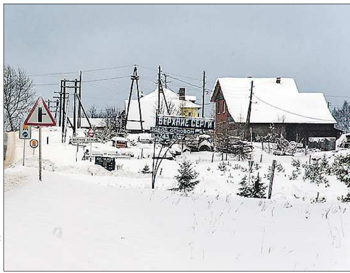
Очистные в Верхних Сергах возведут на условиях государственно-частного партнёрства по венгерским технологиям - будут использованы технологии и наработки будапештского «Водоканала».

Ухудшает ситуацию недостаточное оповещение жителей. Ухудшает ситуацию недостаточное оповещение жителей.