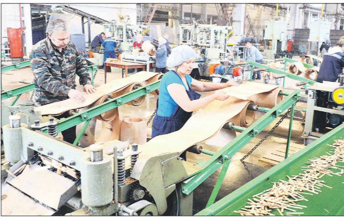
Среди тех, кто продолжает работать – резидент ТСОСР Красноуральск «ЛесКом Развитие». Как пояснили в администрации муниципалитета, предприятие подпадает под критерии указа губернатора...