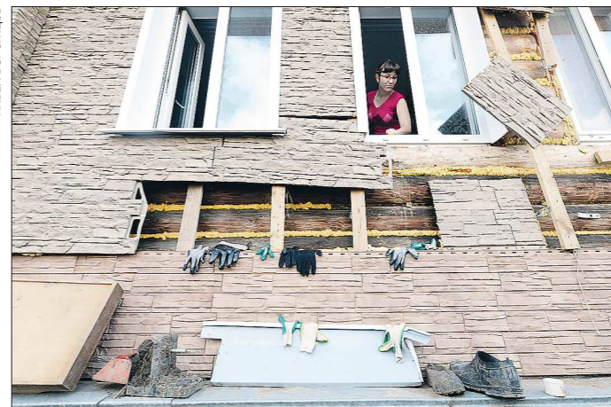
Восстанавливая дома и участки, жители каждый день просушивают рабочую одежду и обувь