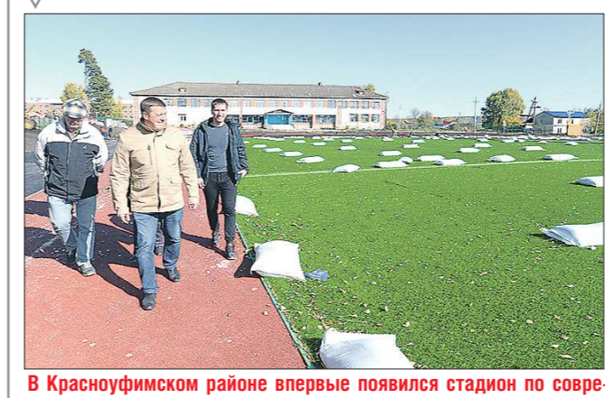
В Красноуфимском районе впервые появился стадион по современным спортивным стандартам. Его построили в этом году в Натальинске – посёлке городского типа, где проживают 1,5 тысячи человек.