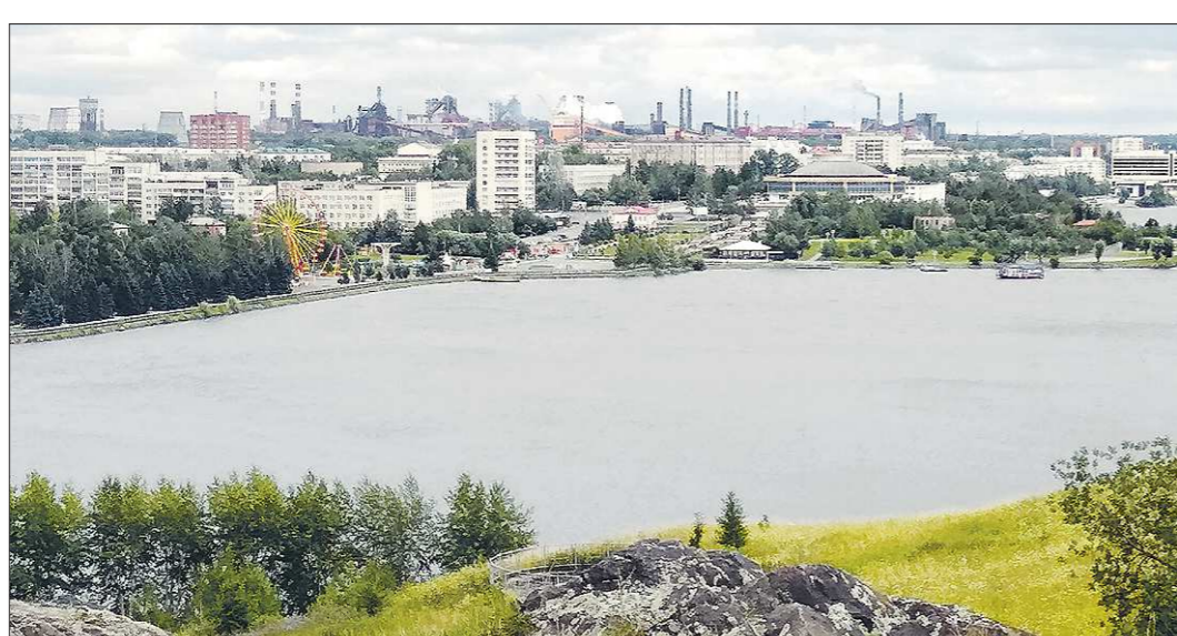
Нижний Тагил долгое время живёт в кольце заводов и шахт