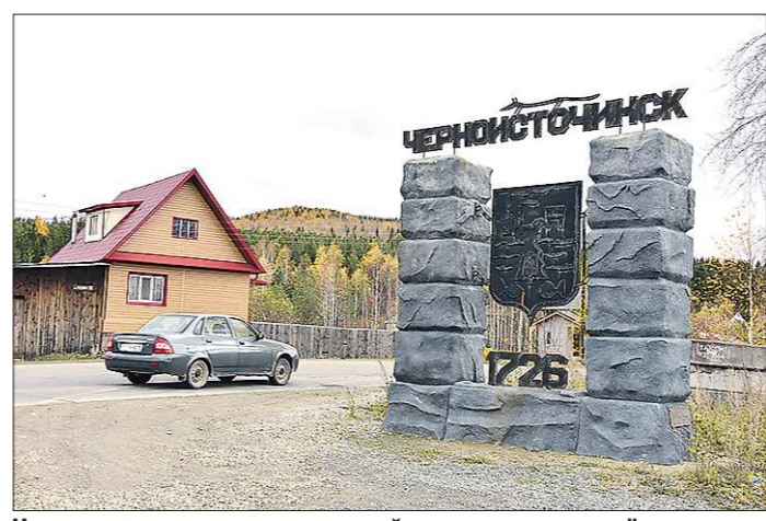
Черносточинск – один из старейших заводских поселков Урала