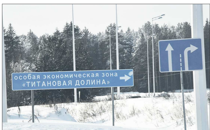
Планировалось, что компания запустит производство в 2021 году. Объем инвестиций должен был составить 848 млн рублей, количество рабочих мест – 83