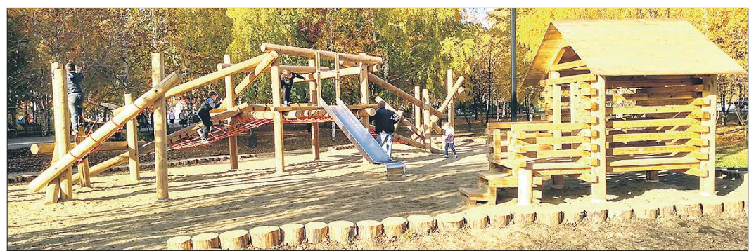
Многие игровые площадки в парке Победы выполнены из дерева

Подготовлено в соответствии с критериями, утверждёнными приказом Департамента информационной политики Свердловской области от 09.01.2018 №1.