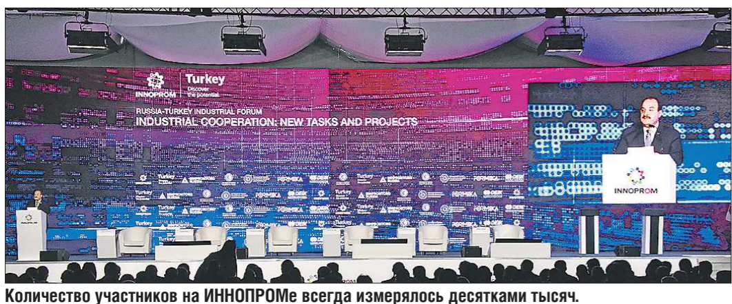
Количество участников на ИННОПРОМЕ всегда измерялось десятками тысяч. Несмотря на пандемию, прогнозируется, что в этом году их будет около 48 тысяч

сообщает о приёме заявлений и документов для участия в отборе сельскохозяйственных товаропроизводителей на предоставление в 2021 году субсидий на поддержку технической и технологической модернизации, инновационного развития сельскохозяйственного производства. Документы принимаются в срок с 1 по 26 февраля 2021 года.