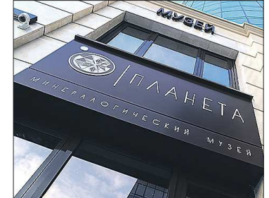
Музей открыт для посетителей с 11 до 19 часов кроме понедельника и вторника. Билеты: 350 рублей (взрослый), 200 рублей (льготный), 100 рублей (для детей 7-14 лет)

сти и Урала. Причём сделан первый зал с таким расчётом, чтобы заинтересовать самую юную аудиторию. В других залах – подземные сокровища из самых разных мест. Ну и в качестве своеобразного десерта – небольшая, но очень любопытная выставка известного уральского ювелира Анатолия Панфилова. Всего около 3,5 тысячи экспонатов.