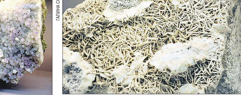
Камень аргонит назвали в честь испанской провинции Арагон. По легенде, это окаменевшие слёзы девушки, разлучённой с возлюбленным