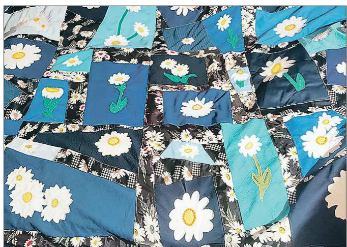
Если дома не нашлось лоскутков, то в магазинах «Ткани» можно купить целые наборы пэчворка, в которые входят обрезки разноцветных тканей