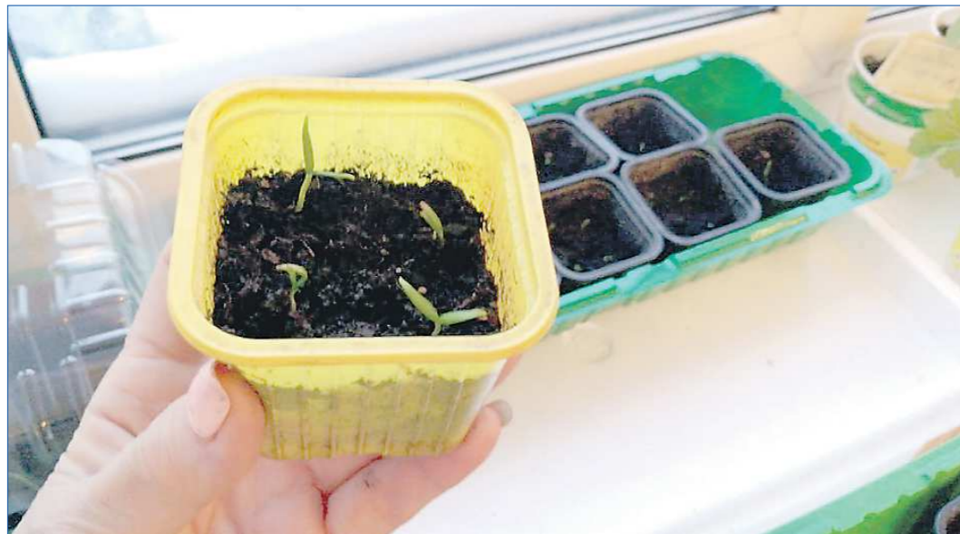
На рассаду высевать лучше проклюнувшиеся семена. Так мы получим ровные всходы, и ничего досевать не потребуется

Поступает наша собеседница так уже много лет — вырастают такие же мясистые вкусные плоды, как и магазинные. Именно ради получения салатных со-