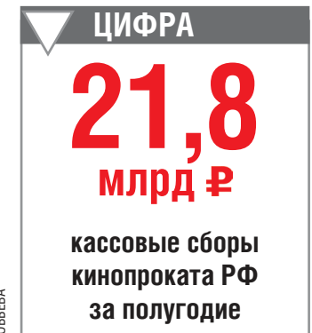
Полностью заполнять зал так и нельзя. Но по сравнению с прошлым летом, когда кинотеатры были закрыты, 75 процентов - это огромная цифра