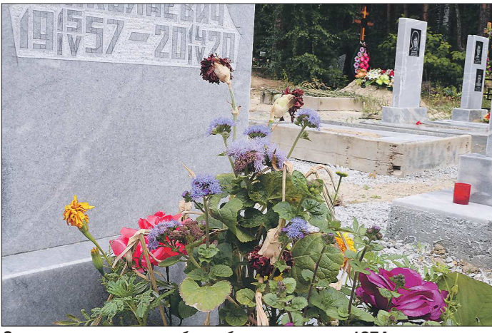
Старое городское кладбище было открыто в 1974 году и к 2012 году исчерпало свои ресурсы

Подготовлено в соответствии с критериями, утверждёнными приказом Департамента информационной политики Свердловской области от 09.01.2018 №1 «Об утверждении критериев отнесения информационных материалов, публикуемых государственными учреждениями Свердловской области, в отношении которых функции и полномочия учредителя осуществляет Департамент информационной политики Свердловской области, к социально значимой информации».