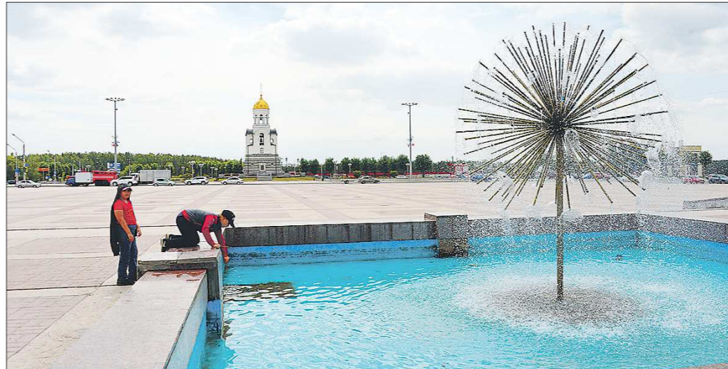
В Каменске-Уральском много благоустроенных общественных пространств и дворов, но жители просят, чтобы их стало ещё больше