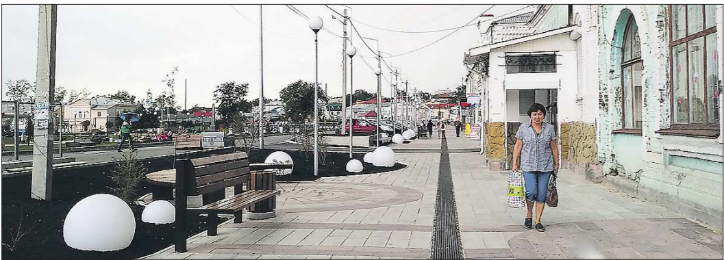
Улица Карла Маркса: старинная архитектура соседствует с современным уличным дизайном

Подготовлено в соответствии с критериями, утверждёнными приказом Департамента информационной политики Свердловской области от 09.01.2018 №1 «Об утверждении критериев отнесения информационных материалов, публикуемых государственными учреждениями Свердловской области, в отношении которых функции и полномочия учредителя осуществляет Департамент информационной политики Свердловской области, к социально значимой информации».