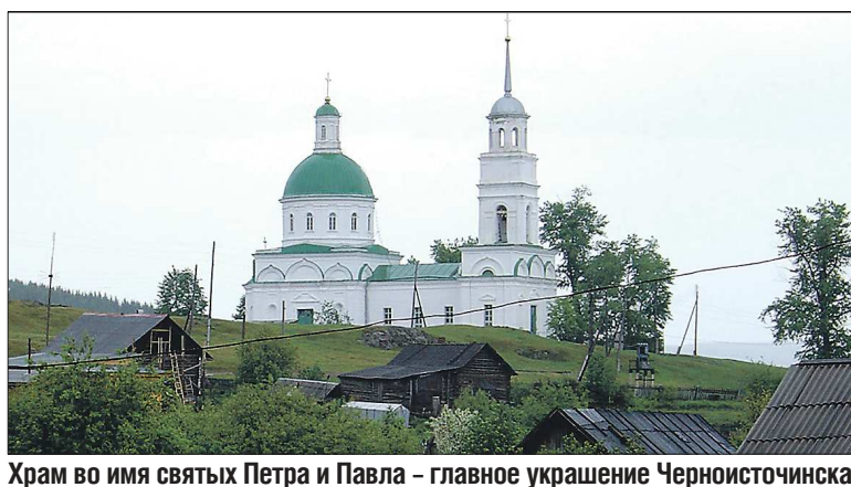
Храм во имя святых Петра и Павла – главное украшение Черноисточинска

Уважаемые члены ЖСК «ЕВРОПА» (ИНН 6659208139)! 24.09.2021 г. состоится общее собрание.