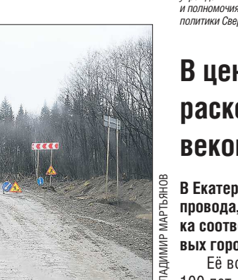
Сейчас дорога Гари – Таборы не соответствует нормативным требованиям

Сейчас два населённых пункта соединит грунтовая дорога, которая находится в плачевном состоянии.