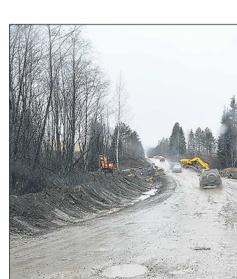
Сейчас дорога Гари – Таборы не соответствует нормативным требованиям

Власти Свердловской области анонсировали строительство дороги Гари – Таборы и моста через реку Сосьва.