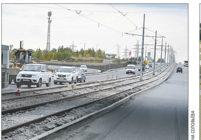
На сегодняшний день рельсы уложены на большей части маршрута будущей трамвайной линии