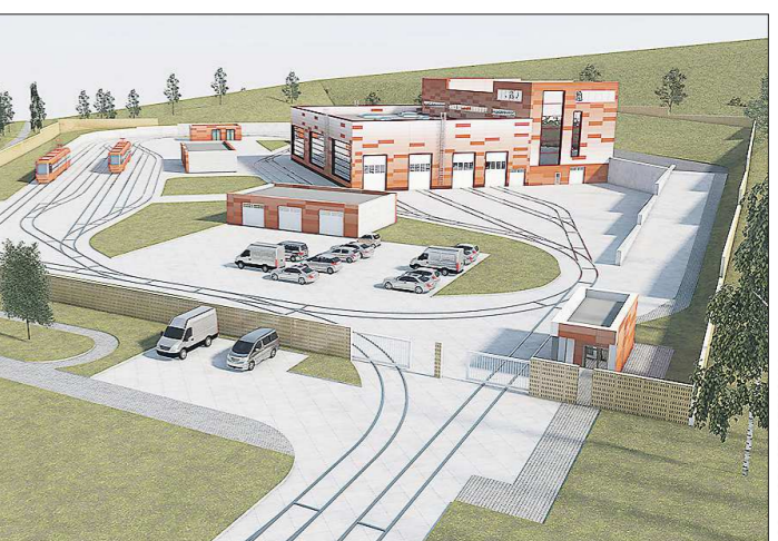
Производственный корпус будет включать в себя участки ежедневного и текущего обслуживания, ремонта подвижного состава и автоматическую мойку