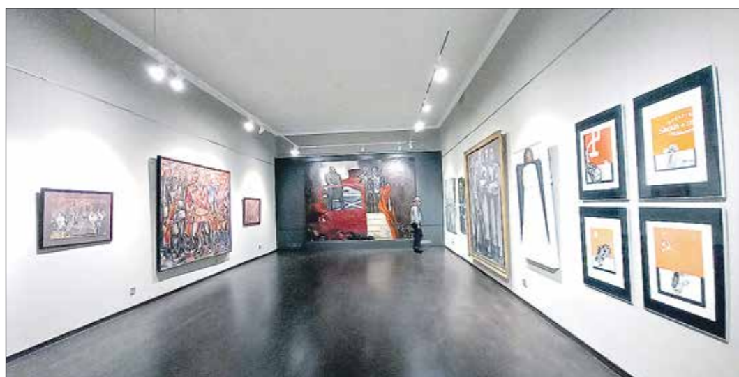
Два взгляда на русскую историю сошлись в одном зале Музея изобразительных искусств