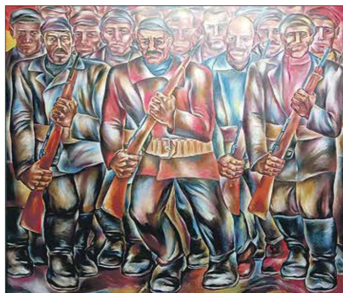
Алексей Константинов «Революция. 1917 год. За власть советов»

Вряд ли высокое и строгое жюри с высоты своей багрово-красной трибуны вынесет какой-нибудь вердикт