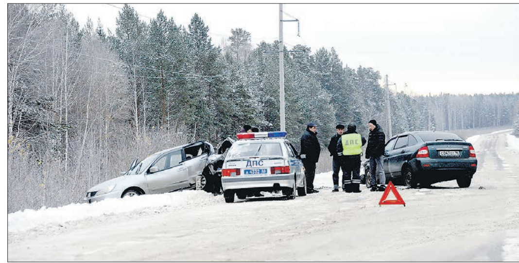
На текущий год для Свердловской области установлен «лимит» на количество жертв ДТП. Показатель, который не должен превышать 320, достигнут за 10 месяцев

В связи с этим ремонт дорог, который подразуме-