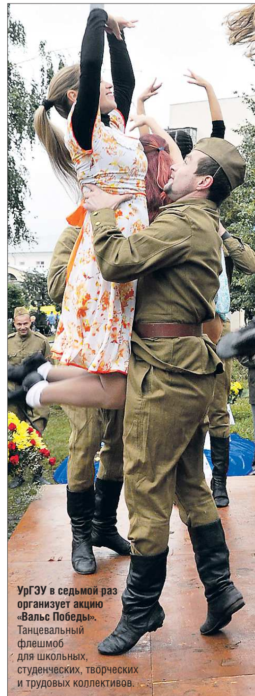
УргЗУ в седьмой раз организует акцию «Вальс Победы». Танцевальный флешмоб для школьных, студенческих, творческих и трудовых коллективов.