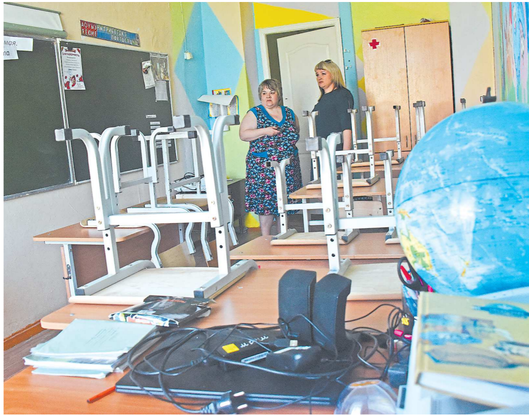
В некоторых кабинетах парты стоят впритык – негде развернуться

Отсутствуют кабинеты технологии: швейные ма-