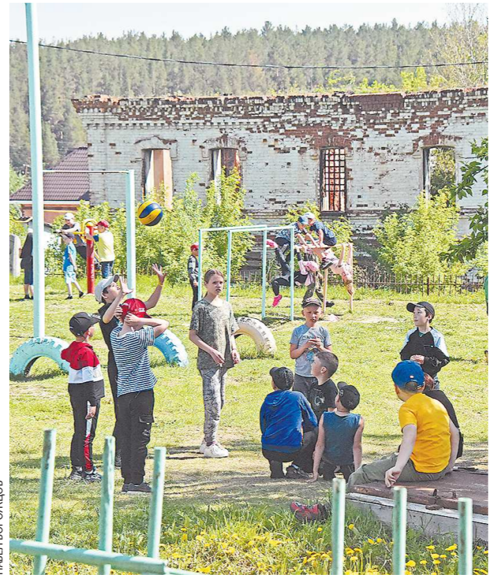
Игровая площадка при школе тоже давно не обновлялась

Решением проблемы может стать строительство новой школы, говорит глава Каменского городского окру-