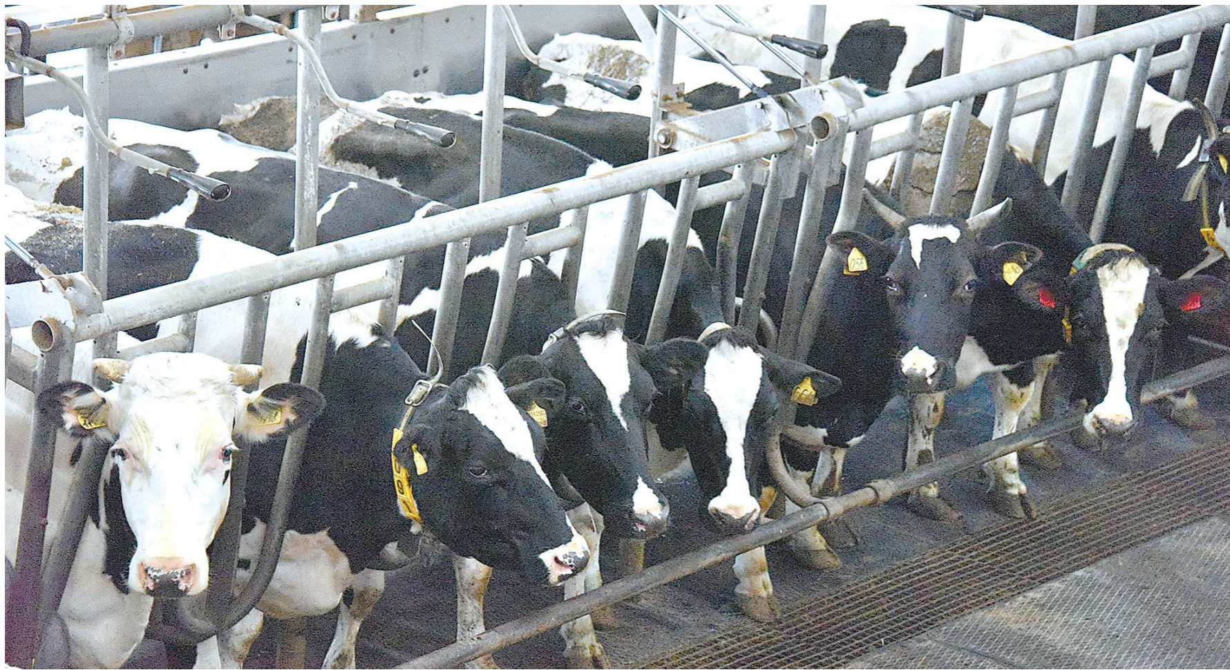
Аграрии уверены, что доходы от продажи молока сопоставимы с доходами от производства органического удобрения

До принятия нового закона правила утилизации отходов жизнедеятельности сельскохозяйственных животных были прописаны в федеральном законе «Об отходах производства и потребления». И, по сути, относительно навоза была правовая неопределенность: это отходы 3–5-го класса опасности (от умеренно опасных до неопасных. — Прим. ред.) или органическое удобрение? Теперь в этом вопросе появилась ясность. Для крупных хозяйств региона ситуация с принятием закона не изменится. У них и до этого процесс сбора отходов был организован грамотно: стоки и навоз помещаются в специальные хранилища — лагуны. Там массы обеззараживаются, и под воздействием