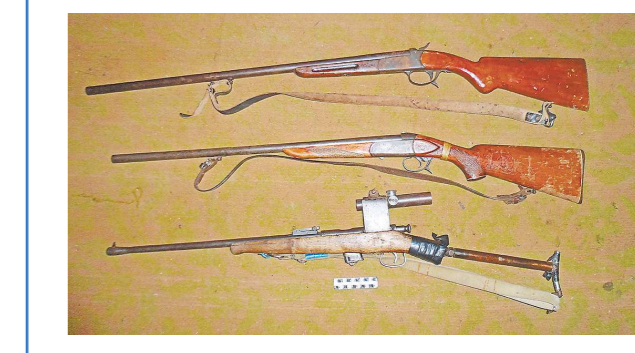
Полиция напоминает: лица, добровольно сдавшие оружие, боеприпасы или взрывные устройства, от ответственности освобождаются, более того – им выплачивается денежное вознаграждение. Если те же самые вещи будут у вас изъяты, то вам грозит ответственность по статье 222 УК. Для добровольной сдачи оружия следует обращаться в территориальный ОВД или к участковому уполномоченному по месту жительства.

В ноябре 2020-го, в подарок от смертельно больного друга, он получил малокалиберную винтовку ТОЗ-17, с оптикой и магазином, в котором находились четыре патрона, а также два охотничьих ружья, две банки с порохом и компоненты для изготовления охотничьих патронов 16-го и 20-го калибра. В феврале 2021-го он самостоятельно изготовил тел и других соответственно 10 и 15 штук. Все вышеуказанное хранит в сейфе, надеясь, что никто об этом не узнает. Как заявил сам обвиняемый, ему было прекрасно известно о незаконном характере этих действий, однако, во-первых, это была память о друге, а во-вторых – сдать весь арсенал в полицию постоянно что-то мешало: то не хватало свободного времени, то гражданам боялся, что его привлекут к ответственности.