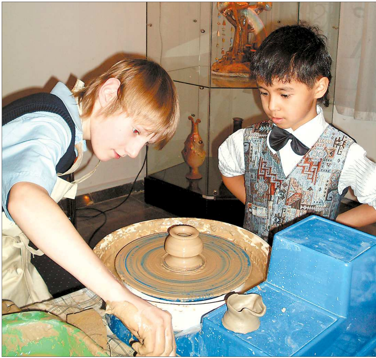
Маленькие умельцы.