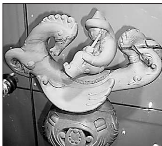
Экспонат выставки.

1936 году была открыта Кунгурская камнерезная школа — с этого началась наша история. Потом добавились работа с металлом, художественная керамика, обработка дерева, ручное ковроткачество,