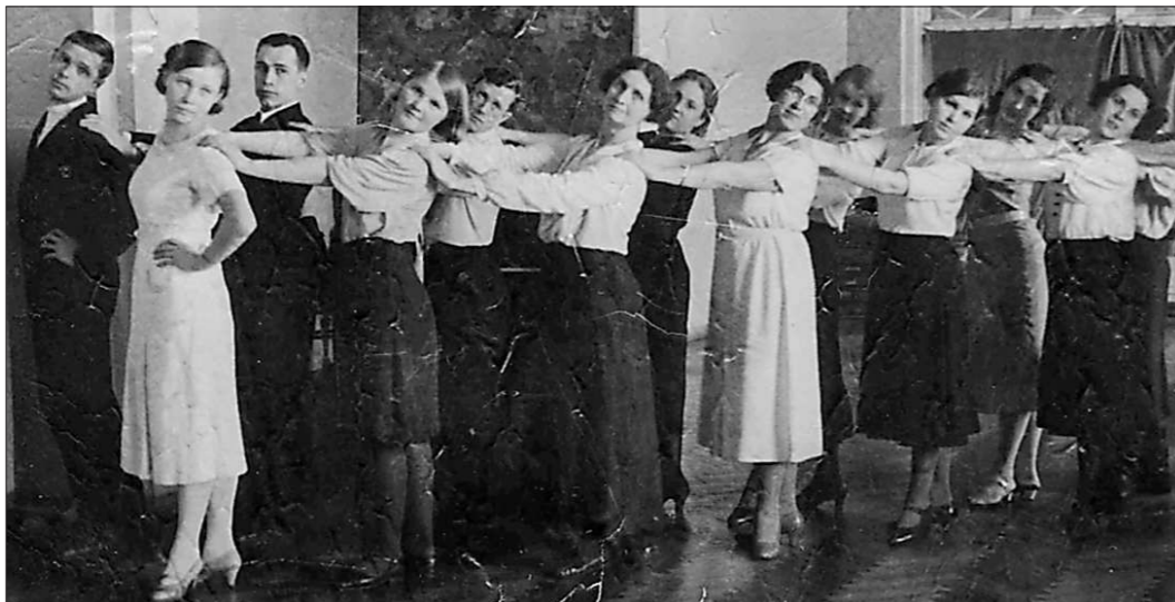
Так танцевали полвека назад.