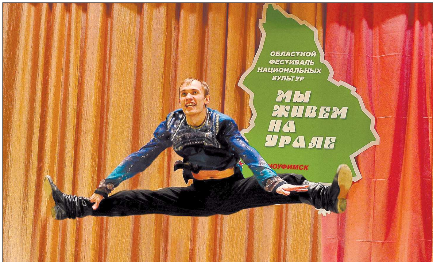
На сцене ансамбль «Русские узоры».

Марийцы, татары Западного округа периодически встречаются на своих национальных фестивалях. Поэтому зрителям знакомы такие марийские коллективы, как «Чолга Шудыр» («Яркая звезда») из Малой Тавры, «Муро Памаш» из Верхнего Потама, коллектив из Курков с тем же названием, которое переводится как «Песенный родник». Не менее известно фольклорное соцветие Ара-