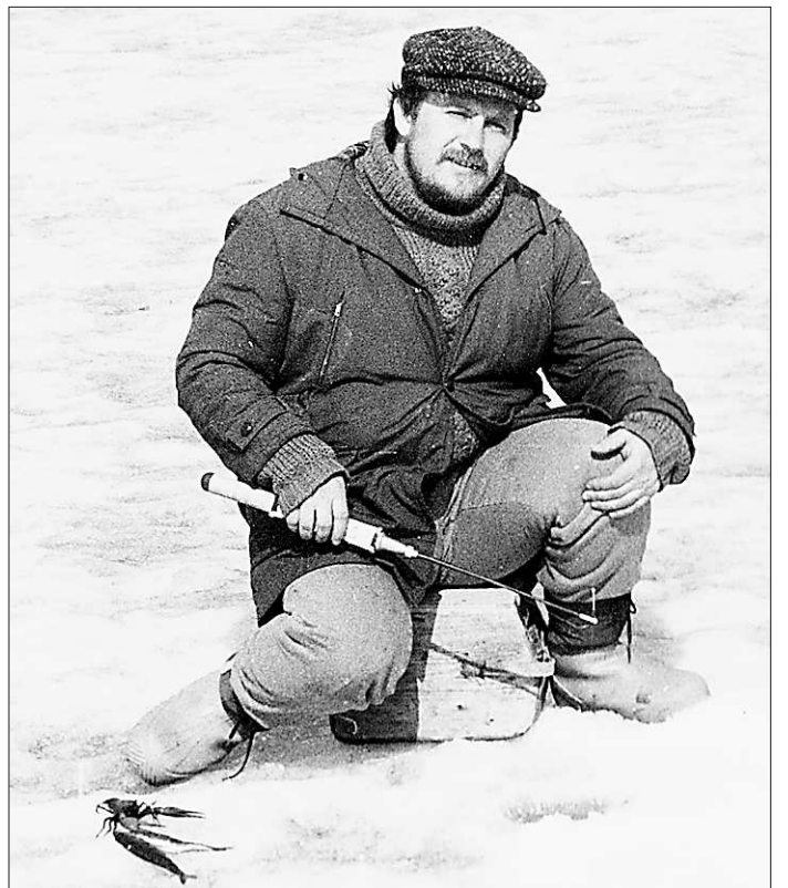
Любимое дело – рыбалка.