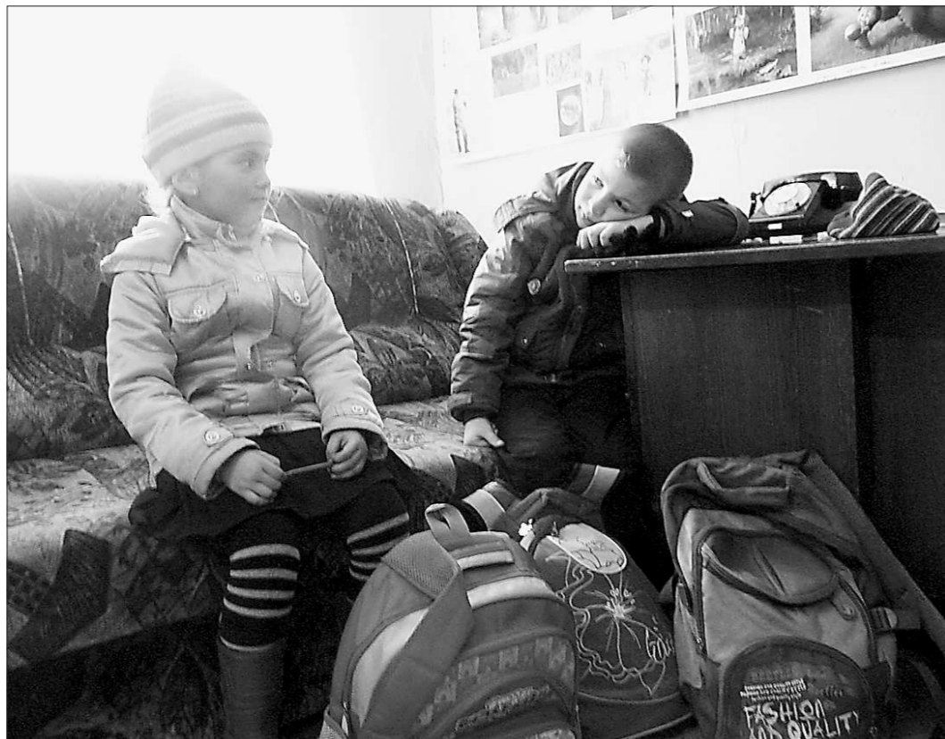
Так и живём... на портфелях.

Правда, этот новый класс, судя по всему, непосредственно в здании 15-й школы учиться не сможет. Ребята вместе с другими уча-