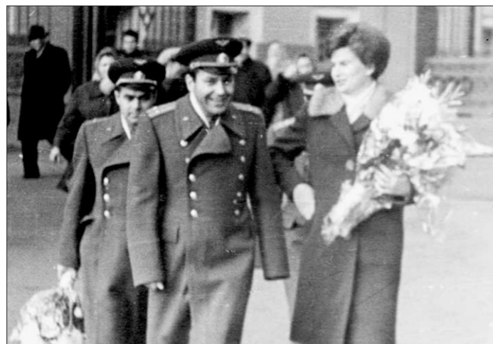
В. Терешкова с коллегами.

К тому времени я уже имел опыт поварской работы (с 1958 г. начинал учеником повара, дойдя до повара 5-го разряда в ресторане «Большой Урал», которому было поручено обслуживание на Дачах обкома КПСС в пос. Малый Исток приезжающих в наш город высоких гостей). В качестве помощника повара мне пришлось помогать готовить блюда для Джавахарлала Неру и Индиры Ганди, президента Финляндии Урхо Калева Кекконена, для императора Эфиопии Хайле Селассие I, Фиделя Кастро, Никиты