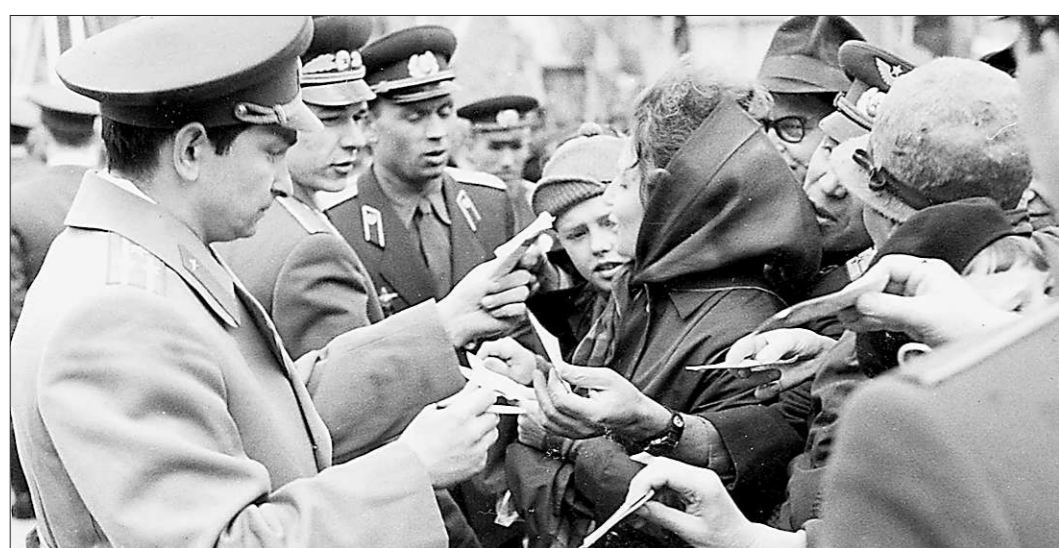
В 60-е годы космонавты были популярны так же, как теперь поп-звезды.