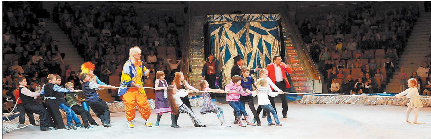
Кто победит?

В финале прозвучал гимн культурных работников района. Клоуны вынесли большой юбилейный торт на сцену, которая согрета аплодисментами зрителей, теплом любви и талантом клубных работников разных поколений.