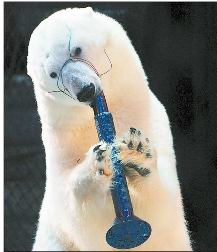
Один из созвездий Большой Медведицы.