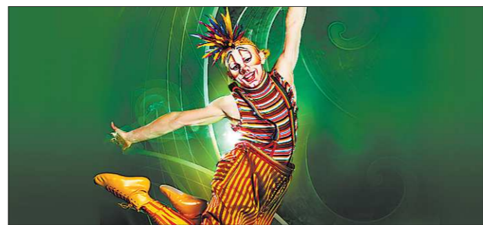
Рекламный плакат программы «Салтимбанко»