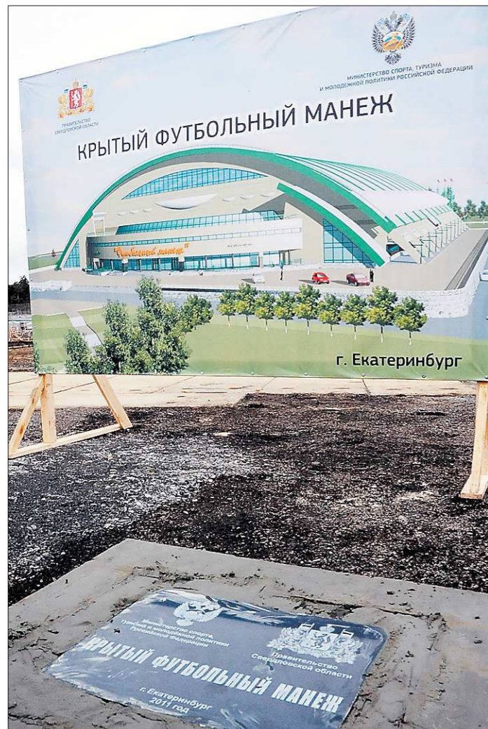
Сегодня и завтра уралмашевского манежа.

«(Смеётся) «Ещё раз!». Соллистам очень «нравится», когда на репетиции я снова и снова прошу: «Пожалуйста, ещё раз...».