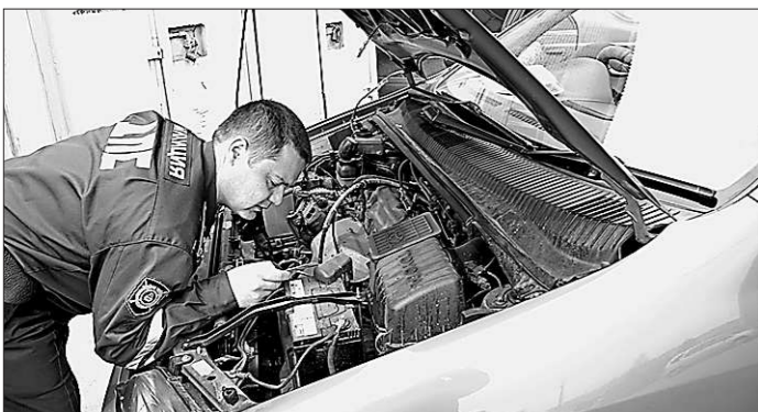
У инспекторов ГИБДД и без техосмотра хватит работы.