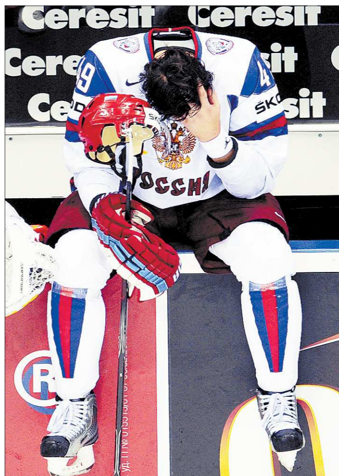
Вне пьедестала Россия не оказывалась с 2006 года

Журналисты призвали Быкова активнее вводить молодежь, но я склонен согласиться с тренером, заявившим, что места в сборной не должны предоставляться авансом, а играть в ней должны все сильнейшие, независимо от возраста. Ссылка на шведов, финнов, канадцев непоказательна – там 19-20-летние «сборники» уже