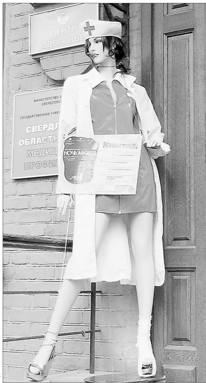
Эта дама приглашала на Ночь в Музей истории медицины

Маршрут «Молодежный» обещал необычные места и трендовые явления для молодых и активных. В основном с задачей справился. Например, в Центре современной культуры УрГУ, где были и «светоморфозы», и инсталляции. Хотя не все задумки авторов были поняты посетителями. «Что это такое? Как понимать?» – удивился молодой человек, наблюдавший за десятком хаотично движущихся, облаченных в чёрное