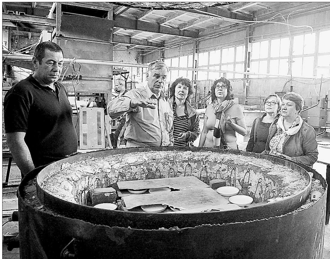
Когда б вы знали, из чего делаются шедевры...

В Невьянске в программу развития туризма включили не только город, но и потенциально привлекательные окрестности: памятники природы – озёра Аяцкое и Таватуй, уникальный проект конгрессной деревни в посёлке Ребристый и Тавола. Программа