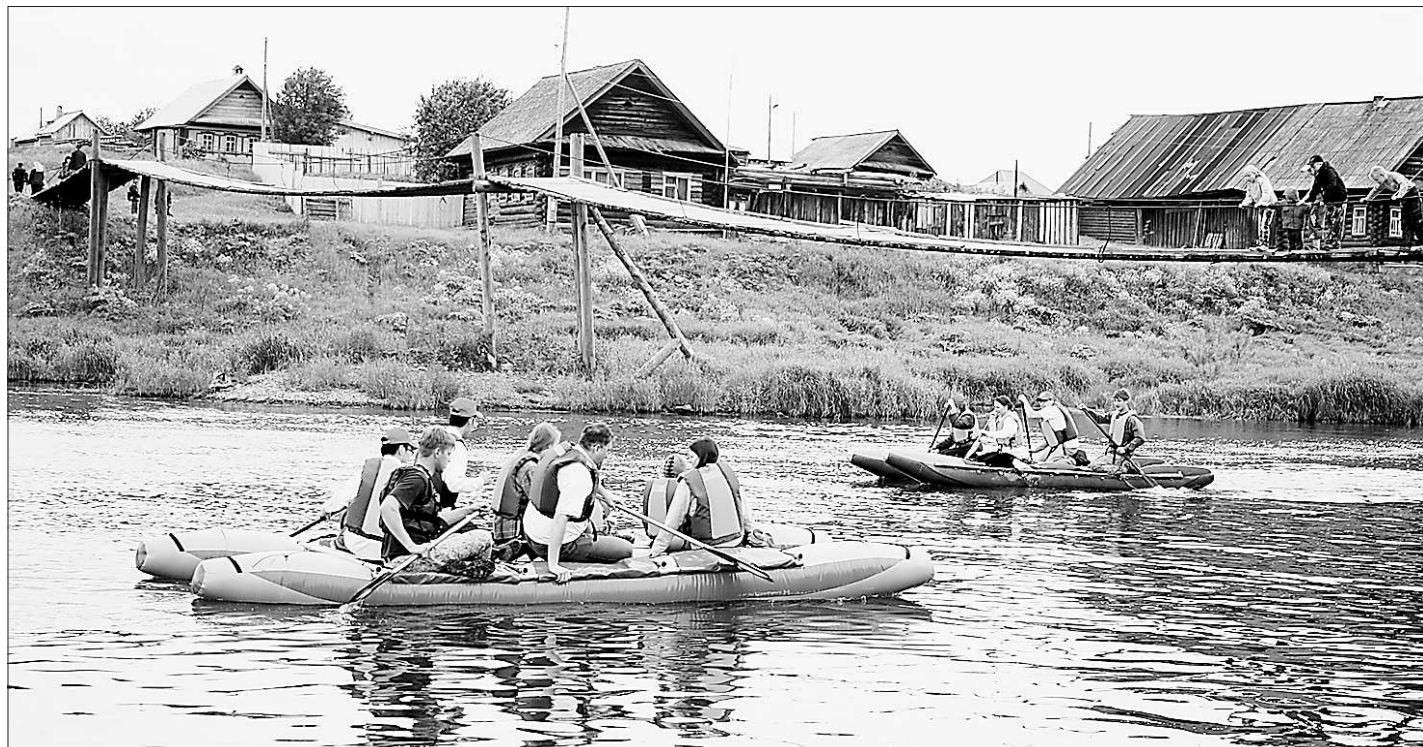
Караван XXI века