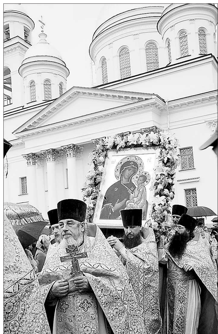
Главная икона у главного храма

Превратности судьбы претерпела и главная чудотворная икона, для сохранения которой ещё в 1560 году по указу царя Иоанна Грозного был устроен на севере Тихвинский мужской монастырь.