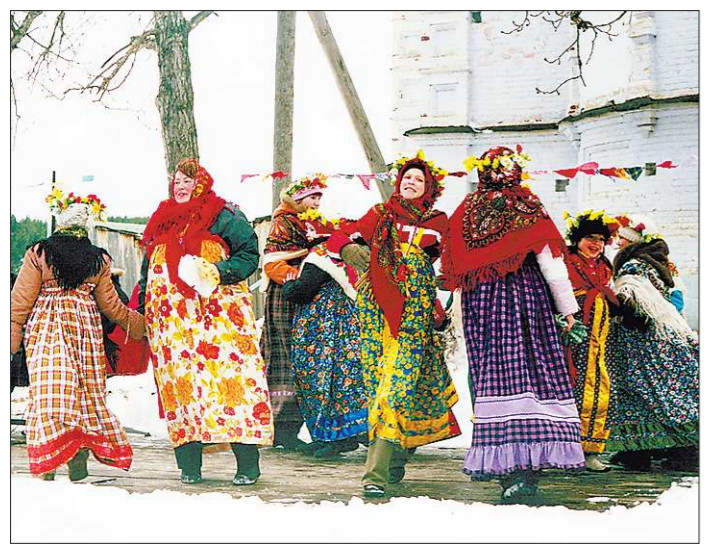
Возрождение русских традиций — приоритет Верхнесысертского ДК