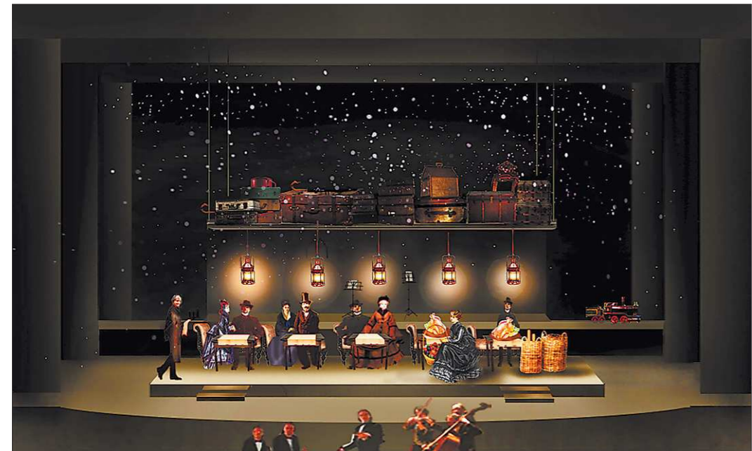
В таком составе руанцы спасли свои тела от немцев. Душу спасла только Пышка

Дебютанты «АгроРока» – группа «Акцент» из Камышлова удивила творческой состоятельностью, органичностью стиля и поведения на сцене. Взрослые дядьки, они