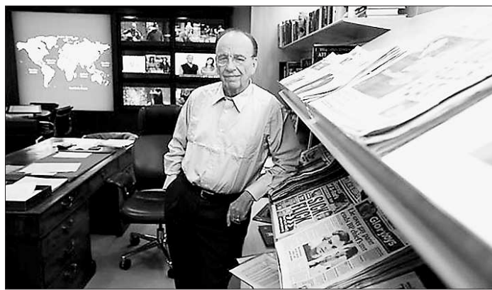
Медиа-магнат Руперт Мердок — в своей империи. Пока...

Кажется, вся Русь (да и соседи-славяне) вовлечена в орбиту покаяния, приобщения к истории, к вечным духовным ценностям. Эту роль год от года всё ярче и шире играет православный фестиваль «Царские дни».