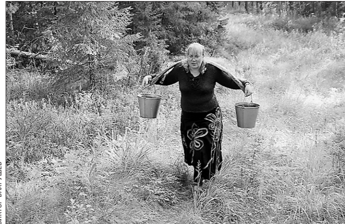
Повторно публикуем привлёкший всех снимок.

–Спасибо за интервью! –На прощание вопрос у меня – когда в следующий раз пойдём в оперный?..