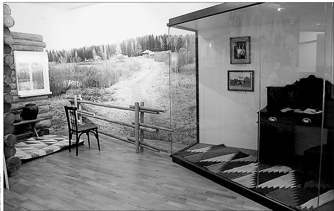
Из экспозиции в музее: кусочек детства Ники Кузнецова — родная деревня Зырянка