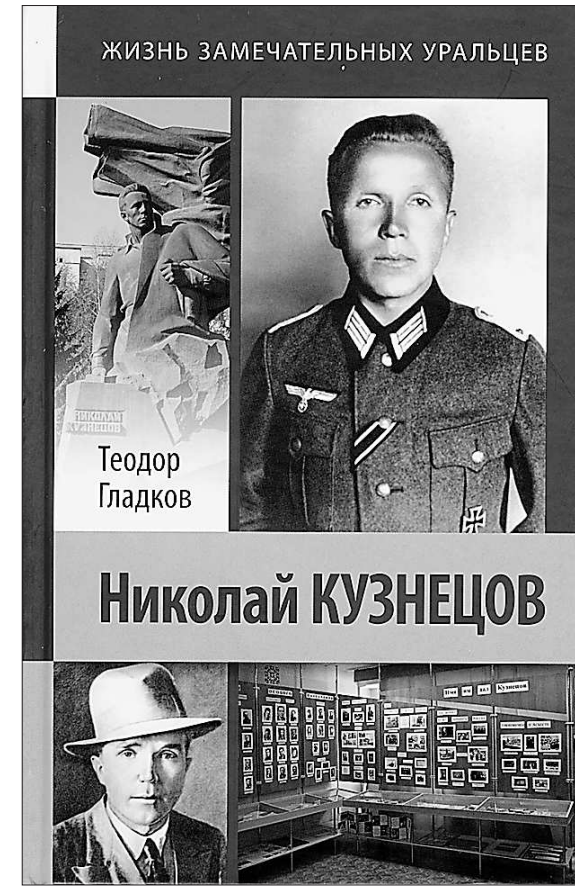
Большой тираж этой книги уже весь распределён