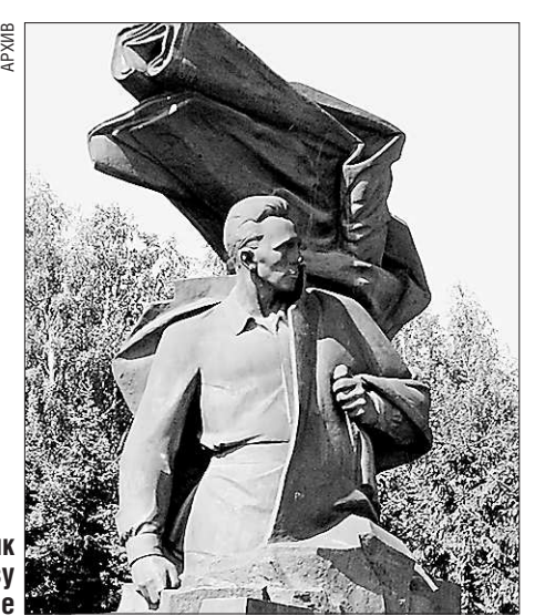
Памятник Н. Кузнецову на Ураламше

Пусть я умру, но в памяти моего народа патриоты бессмертны. «Пушкой ты умер!.. Но в песне смелых и сильных духом всегда ты будешь живым примером, призывом гордым к свободе, к свету!.. Это моё любимое произведение Горького. Пусть чаще читает его наша молодёжь... Ваш Кузнецов».