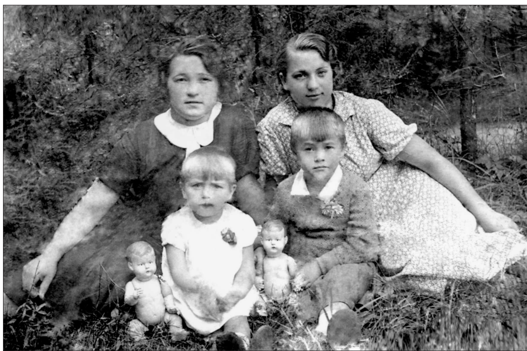
Лето 1941 года: такими мы прибыли на Урал, мама — слева

Пока ехали до Москвы, много раз попадали под