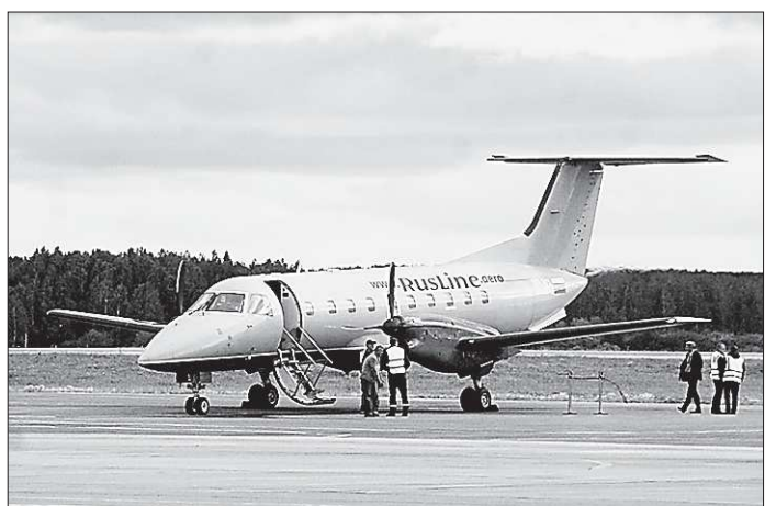
Этот «малыш» доставит тридцать человек в Тюмень за 40 минут

Президент РФ Дмитрий Анатольевич Медведев заявил о необходимости вывода из эксплуатации в 2012 году устаревших российских Ту-134, Як-40 и Ан-24. Заменить их на региональных маршрутах пока можно только иностранными воздушными судами. Покупка самолетов авиаконцерном и передача их в эксплуатацию авиакомпания-партнеру — неординарный опыт не только в России, но и в мире. Однако мы считаем, что такой опыт просто необходим для полноценной реализации нашей программы развития региональных перевозок.