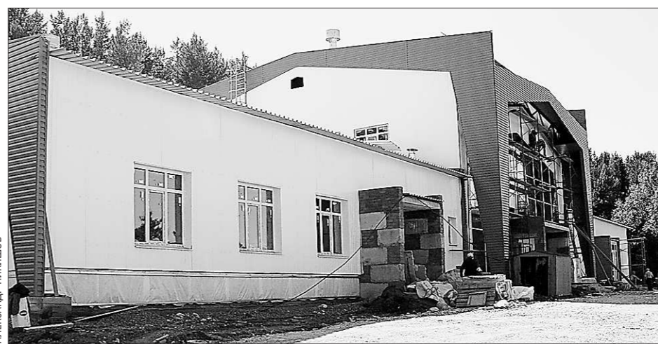
...а на этой можно замahнуться на соревнования всероссийского уровня