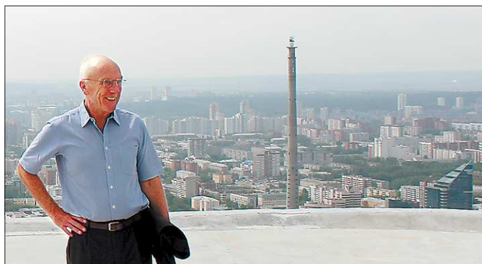
Эксперты считают, что участие в проекте знаменитого архитектора упрощает привлечение инвестиций