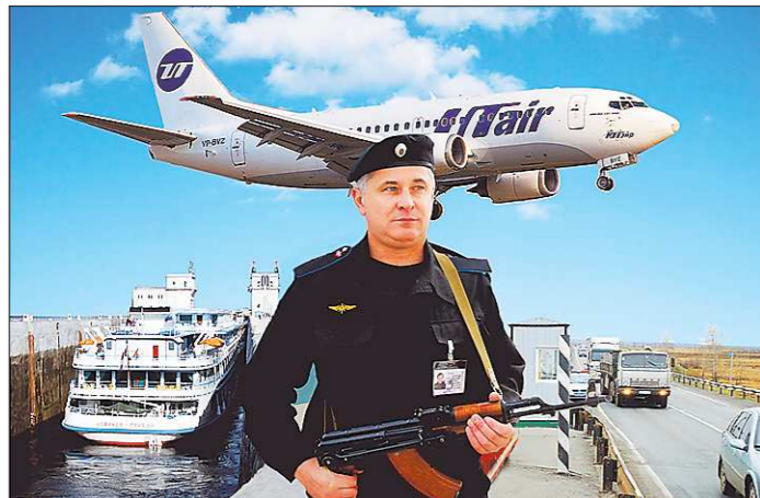
От Калининграда до Владивостока на страже – ведомственная охрана Минтранса России

Обладатели ельцинских стипендий вообще оказались людьми чрезвычайно неравнодушными. Они переживают за то, что происходит в стране и в мире. Стипендиатами