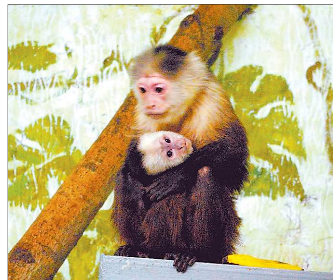
Белоплечий капуцин Авантюрина с малышом