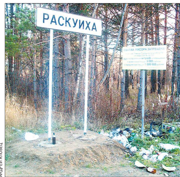
Проблема мусора стала одной из самых обсуждаемых на слушаниях

Вообще, трёхчасовая дискуссия в Раскуихе получилась весьма оживлённой. За это время удалось, пожалуй, лишь выявить острые вопросы, но получить конкретные ответы, увы, не получилось. У каждой из сторон оказалась своя правда. Но главным положи-