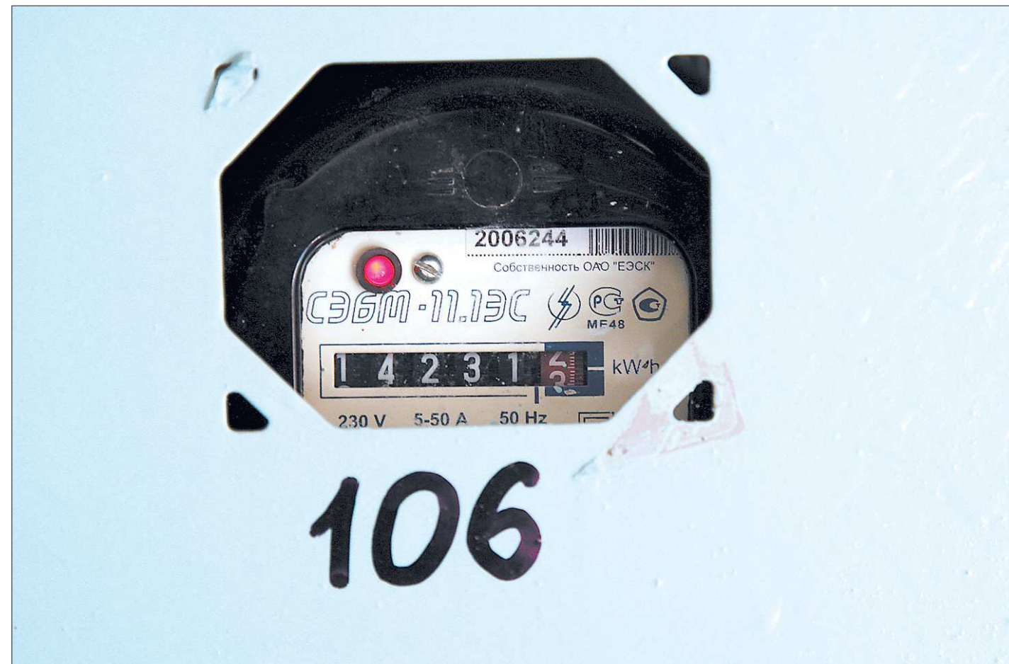
По мнению экспертов, новая система тарифообразования может привести к существенному удорожанию услуг ЖКХ

Все эти меры очень своевременны. При этом кризиса у нас в регионе наполовину «вымывало» количество новостроек — по нормам на один сдаваемый миллион квадратных метров положено иметь три с лишним миллиона задела, а сегодня у нас его всего чуть более полутора миллионов. Кроме того, необходимо сократить и число процедур согласования для получения разрешения на строительство — в среднем по стране на один объект их приходится 119. У нас меньше — 70, но передовые регионы снизили эту цифру до 49.