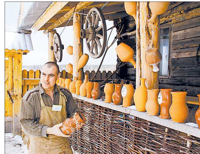
Если найти удачный компромисс между рублим и творчеством – дело пойдёт

Увы, приказали долго жить туринская игрушка, богдановичский фарфор, уже не производят расписную деревянную посуду в городе Реж, закрылись камнерезные и ювелирные производства в посёлке Малышева, давно банкрот завод «Русские самоцветы», да остались кузнечные и камнерезные мастерские, но их можно пересчитать по пальцам.