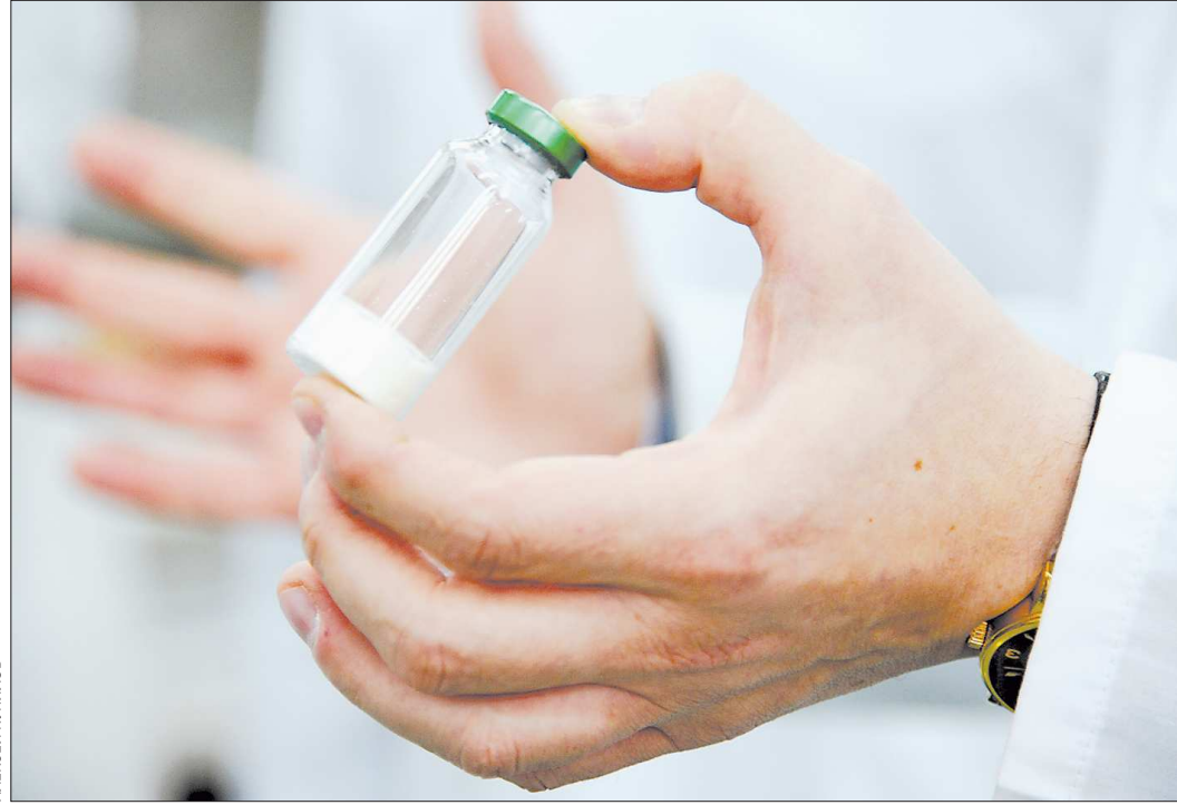
Стоимость этой бактерии на мировом рынке – 50 миллионов евро

В мае 2012 года, после четырехлетней исследования, уральские ученые запатентовали свою бактерию – за покупку аналогичного микроорганизма французского производителя инсулина, к примеру, запрашивали 50 миллионов евро.