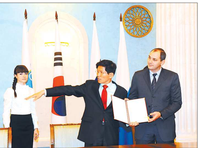
Свердловская область и провинция Кёнгидо создают совместные предприятия.

В ходе визита корейской делегации на Средний Урал председатель правительства Свердловской области Денис Паслер (справа) и губернатор провинции Кёнгидо господин Ким Мун Су подписали протокол о намерениях о развитии межрегионального сотрудничества, а также меморандум о сотрудничестве между провинцией Кёнгидо и корпорацией «ВСМПО-Ависма». Стороны заинтересованы в создании совместного предприятия по производству титановых труб на территории Кореи, а также в создании совместных производств на площадке «Титановой долины».