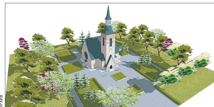
Проект нового лютеранского храма в Екатеринбурге (рабочий вариант)

большие планы у православной церкви. Епархия хотела бы вернуть все свои бывшие владения в Екатеринбурге. Кроме того, она настаивает на том, чтобы построить церковь в Ботаническом микрорайоне. Мы планируем выделить