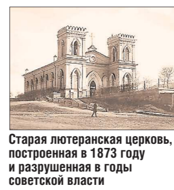
Старая лютеранская церковь, построенная в 1873 году и разрушенная в годы советской власти