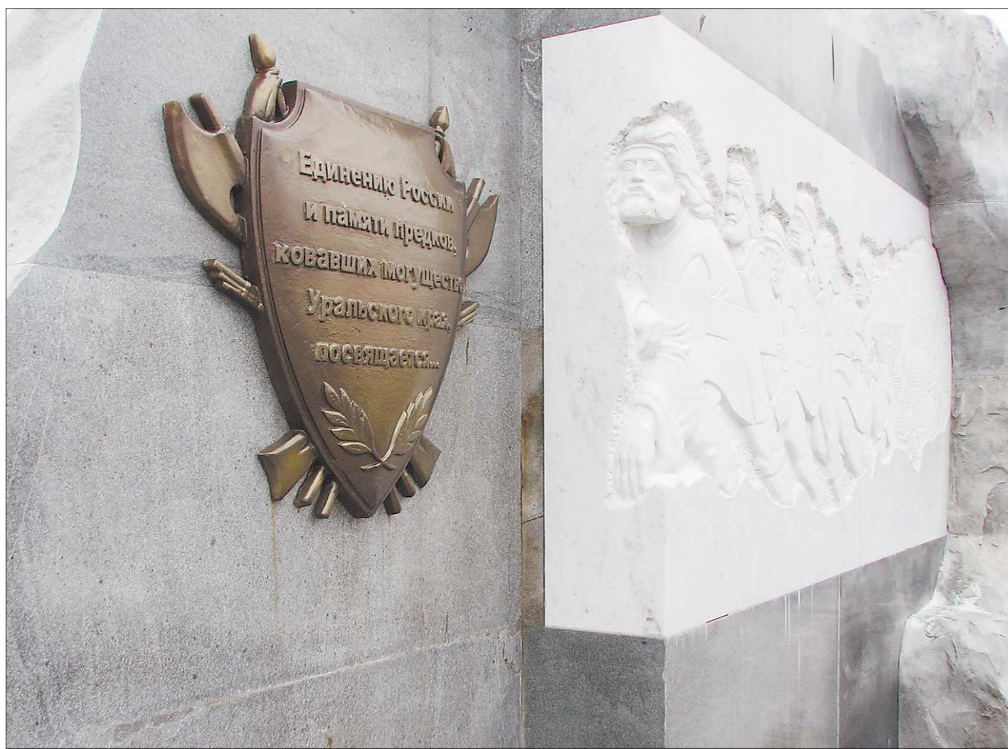
Памятник на Чусовой был задуман как дань уважения нашим предкам. Мастеровитым уральцам, воспринимавшим тяготы Родины как личную беду

Жители Усть-Утки издревле занимались земледелием, но основные их промыслы - славное дело и бурлачество. Когда Демидовы начали строить на Урале заводы, они выкупили у Строгановых пристань на Чусовой, и она стала одной из главных в отправке железных караванов. Всю зиму на верфи кипела работа - местные умельцы строили барки-коломенки.