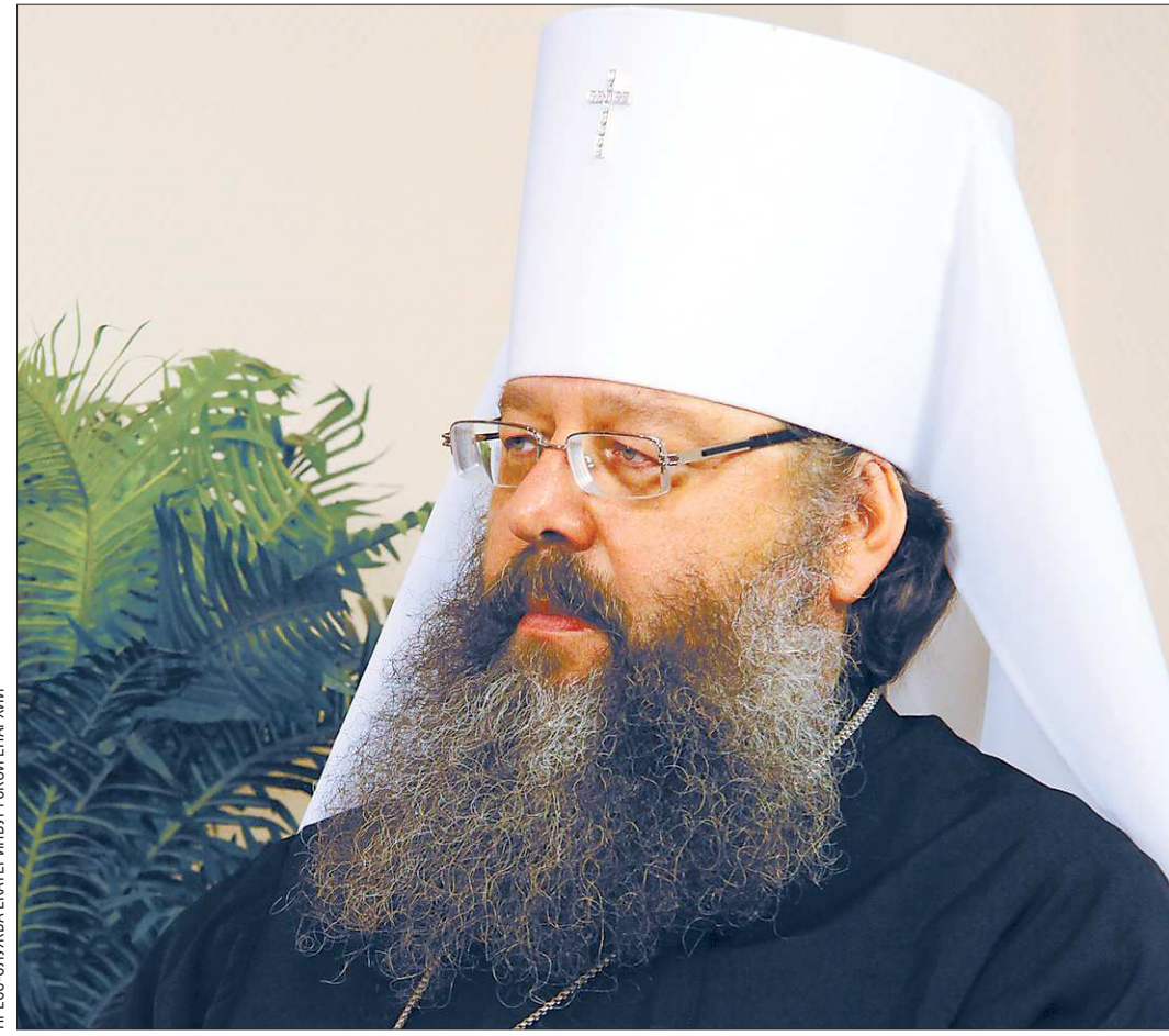
МИТРОПОЛИТ КИРИЛЛ: «ХОТЕЛОСЬ БЫ НАПОМИНЬ ЛЮДЯМ, НАСКОЛЬКО ВАЖНО ИМ БЫТЬ ВМЕСТЕ»

—Я бы сказал о попытках разжигать не вообще антиклерикальные, а именно антиправославные настроения. Но это сегодня мы наблюдаем по всей стране. Потому что в жизни далеко от Церкви приходится делать выбор – либо мы остаемся на национальных традициях, либо ввернем страну в какие-то безудержные либеральные свободы западного образца. Если откажемся от национальных традиций, то неизвестно, что вообще будет с нашим народом, с нашей страной. Но ничего необычного в антицерковных напаках нет. Необычным, скорее, было то, что церковь наша жила 20 лет в ситуации достаточной свободы. В Екатеринбурге антиправославные выпады, конечно,