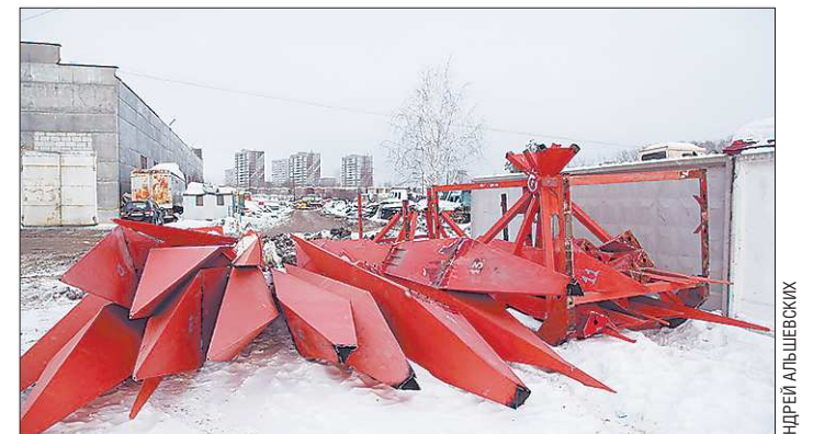
Эту композицию демонтировали в ночь на 26 января. Учитывая условия «хранения», сложно представить, что она будет восстановлена