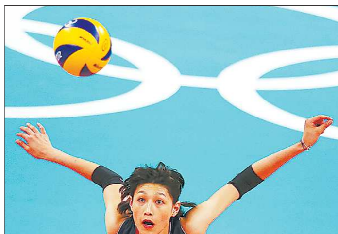
Главной звездой этого вечера стала корейская легионерка «Фенербахче» Ким Ён Кун

Подрастающая смена участников «Русских певчих» — сводный хор мальчиков и юношей Свердловского мужского хорового колледжа. Получается, музыкальные таланты выходят на сцену изпод одного «крыла». В финале вечера «От Армстронга до «Квин» больше ста хористов (это три поколения) спели «Спасибо за музыку» («Thank you for the music») группы «АББА». Наверно, в этом и есть преемственность уральской хоровой традиции, которая обнаруживает столько своих, местных талантов. И за это тоже хочется сказать спасибо.