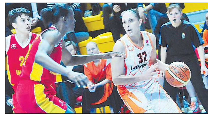
Баскетболистки «Фенербахче» Альба Торренс, Сильвия Фаулс и «Лисица» Дайана Таурази (слева направо) уже выигрывали Евролигу с другими командами. И в этом году они выступают за клубы, претендующие на победу в турнире

Екатеринбургская женская баскетбольная команда «УГМК» в заключительном матче группового этапа Лиги чемпионов обыграла на своей площадке турецкий «Галатасарай» (61:45) и заняла первое место в группе.