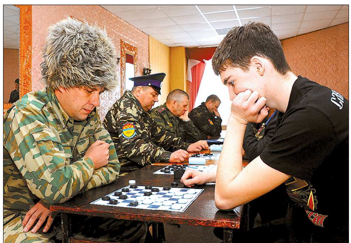
«Командир обязан думать, а не просто шашкой махать» (цитата из к/ф «Офицеры»)