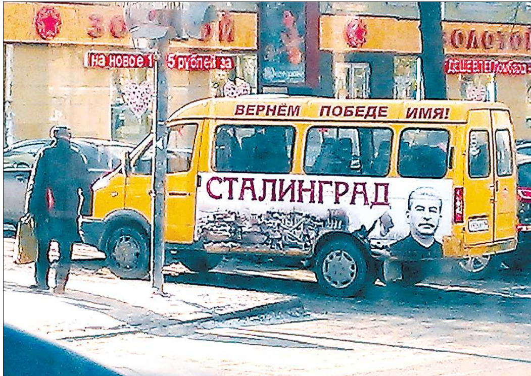
«Сталинобусы» на улицах Екатеринбурга не каждый день увидишь: видимо, из конспирации они меняют маршруты. Этот вчера ехал в Арамиль...

Сталин юридически не преступник, хотя инициированные им репрессии официально осуждены. Тогда кто же он? И почему день его кончины спустя даже 60 лет оказался так важен некоторым — немалым, скажем честно, слоям общества? Почему вспоминается вновь и вновь? Ответ на этот вопрос я предложил поискать самым разным людям — беспартийному учёному, коммунисту, правозащитнику. Спросил друзей: как они объясняют, что маленькое со-